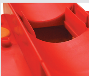
Pestañas de protección del tubo

Único equipado con boya desembragable. Cable en acero inoxidable. Registro para la sirga, que garantiza una perfecta linealidad de las tensiones ejercidas, reduciendo así los rozamientos y consiguiendo un perfecto funcionamiento del sistema.